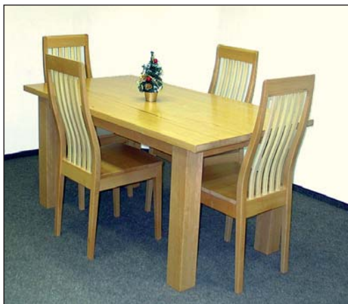
Stůl a židle z masivu v elegantním provedení od firmy Dřevo Plus.

► protože u moře je velká relativní vlhkost. Snad jednu radu pro ty, kteří si staví rodinný dům. My jim doporučujeme, aby stavbu nechali řádně vyschnout a potom jí dali konečný kabát v podobě omítky. Syrová stavba, která se uzavře omítkou, má za následek, že dřevěná eurookna natáhnou