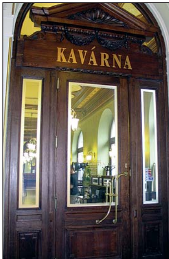
Replika historických dveří v Měšťanské besedě v Plzni.

„Naši velkou předností je, že máme vlastní sušárnu. V ní si připravíme řezivo takové vlhkosti, jaká má být v nově budovaném nebo opravovaném objektu. Sušíme dřevo podle toho, do jakého prostředí má přijít. Například sibiřský modřín na fasádní obklady do Irsku sušíme na 16%, ▶