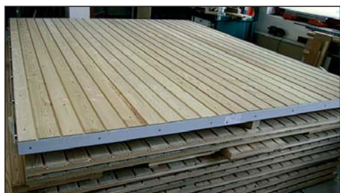
Dřevěné fasádní obklady ze sibiřského modřínu jsou odolné vůči vnějším nepříznivým podmínkám.

vyrobila okna z mokrého materiálu. Chyba ovšem není na naší straně, což mnozí nedovedou pochopit.“