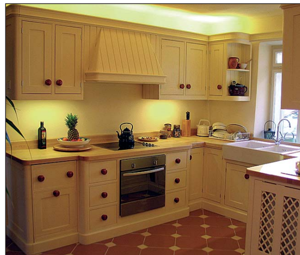
Kuchyňská linka z masivu vyrobená podle přání zákazníka.